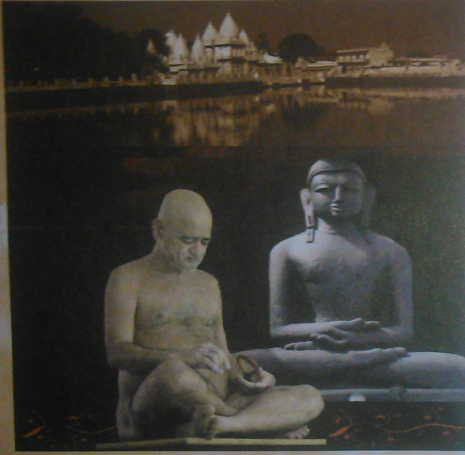
बड़े बाबा भगवान आदिनाथ जी - छोटे बाबा जैनाचार्य विद्यासागर जी महामुनिराज BADE BABA BHAGWAN AADINATH JI - CHHOTE BABA JAINACHARYA VIDYASAGAR JI MAHAMUNIRAJ